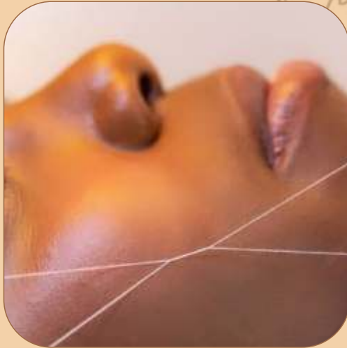
TABELA DEPILAÇÃO NA Linha